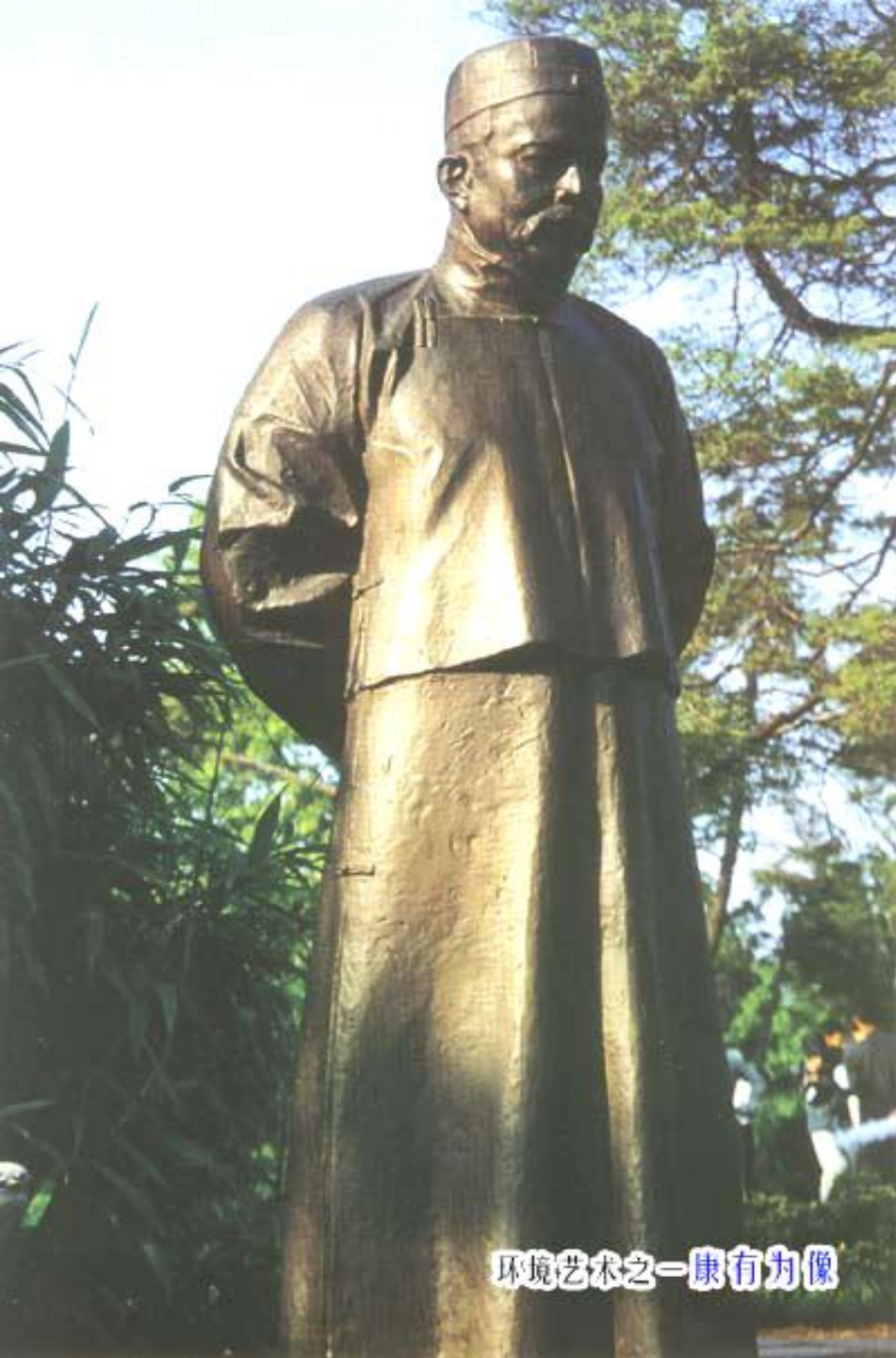
环境艺术之一—康有为像