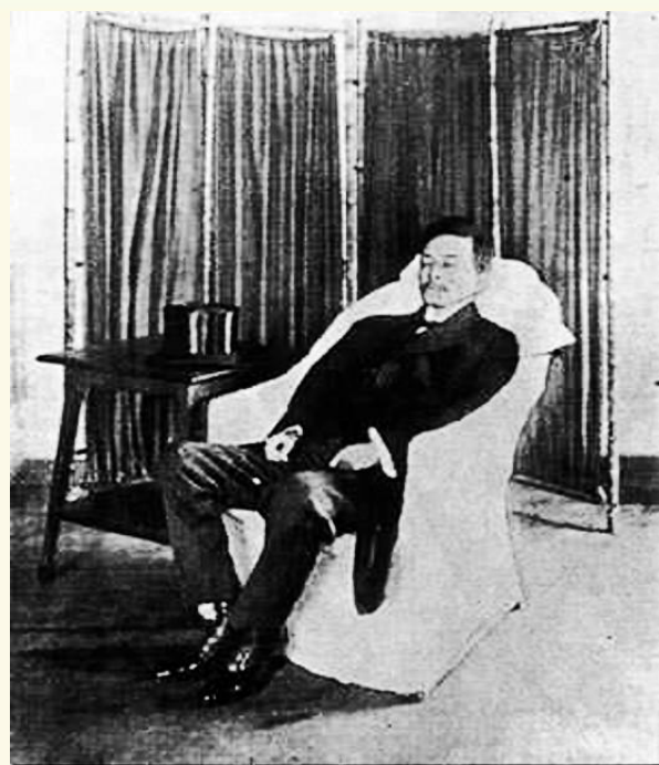
一心要搞民主政治国民党 理事长宋教仁被袁刺杀