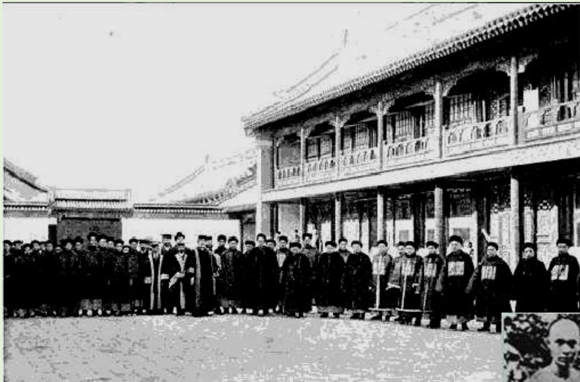
京师大学堂的藏书阁