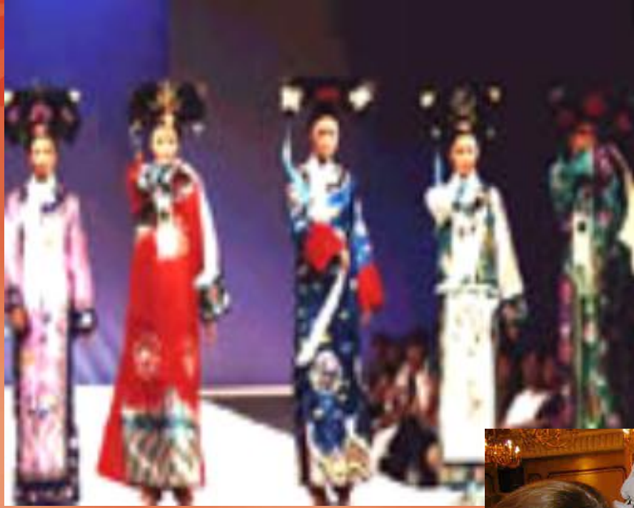
中国民族服饰表演