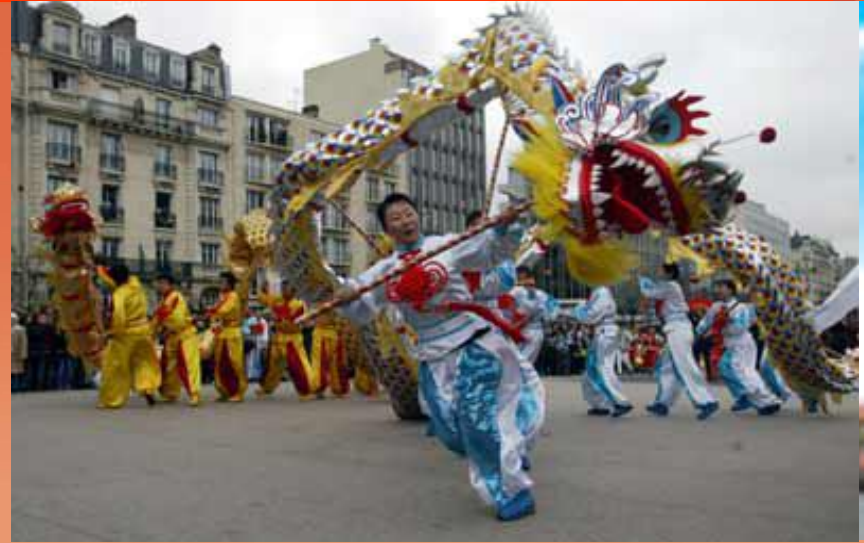
北京风情舞动巴黎