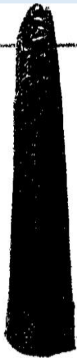
《汉谟拉比法典》石柱

◇ 在古巴比伦，公元前18世纪制定的《汉谟拉比法典》刻在一个高2.25米的石柱上，竖立在巴比伦的神殿里，它是世界上现存最早、保存最为完整的一部成文法典。