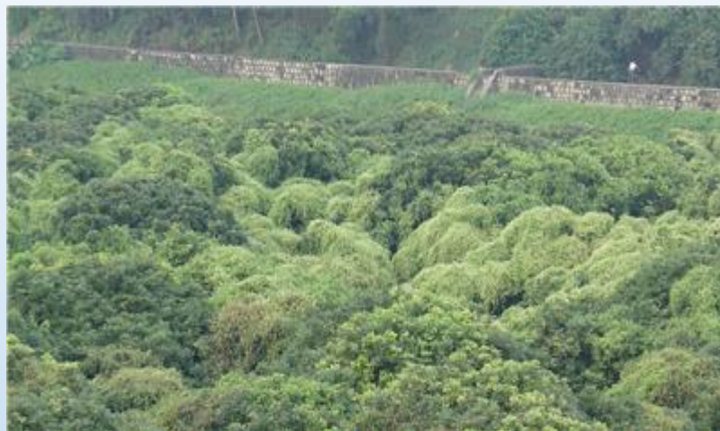
迅速蔓延开来的薇甘菊