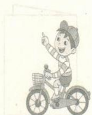
B. 沿直线骑自行车的人的运动