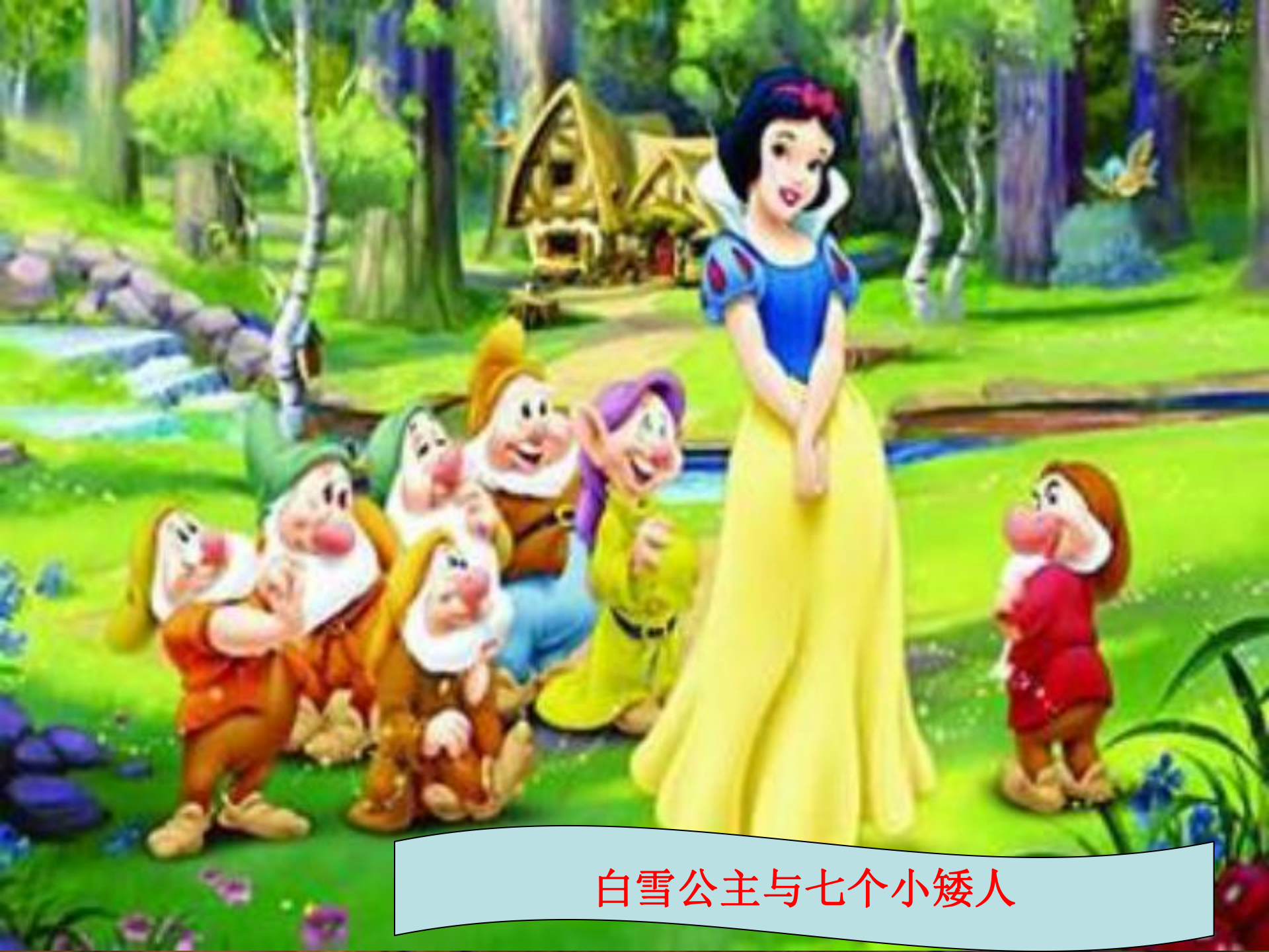
白雪公主与七个小矮人