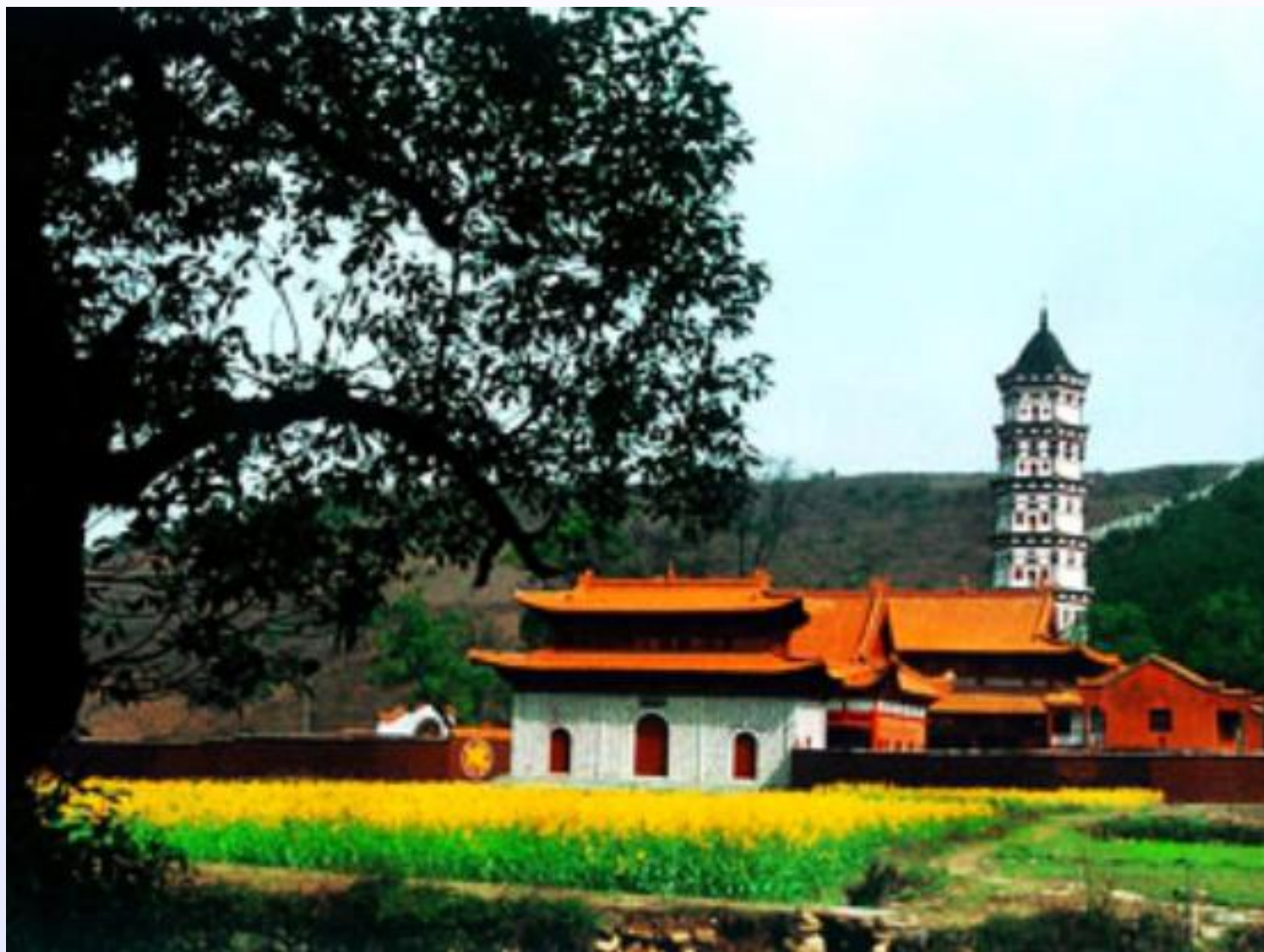
西 林 寺