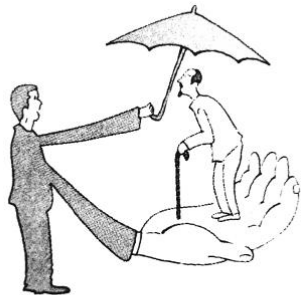
伸出你的手,奉献爱心