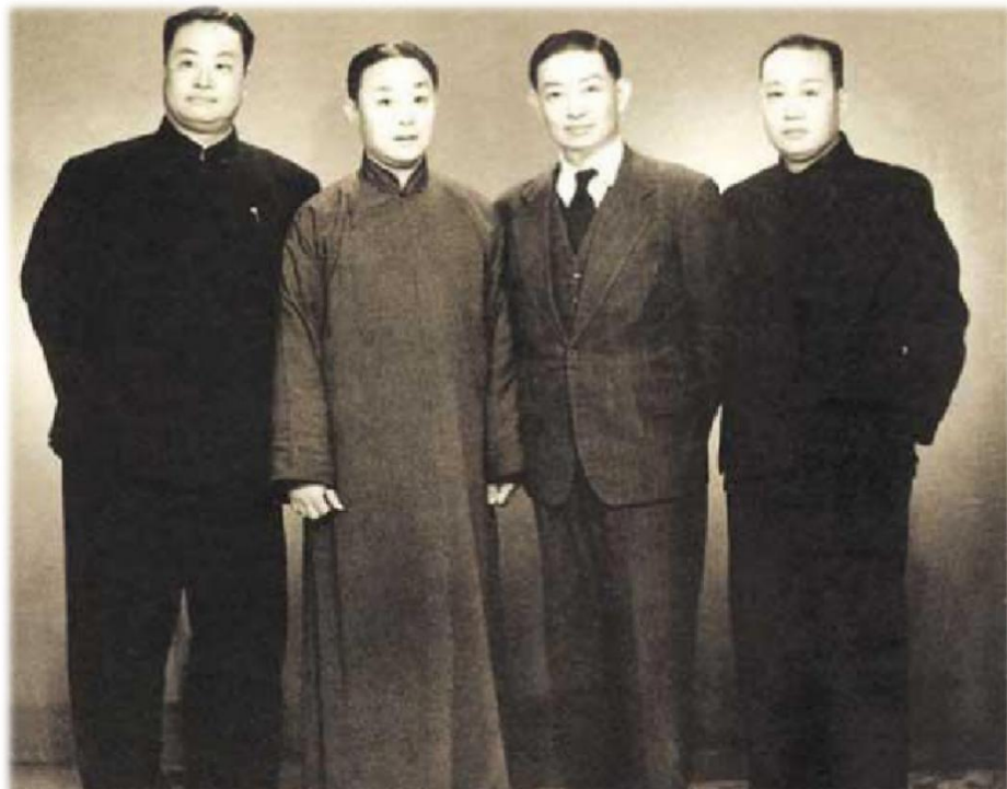
程研秋 尚小云 梅兰芳 荀慧生