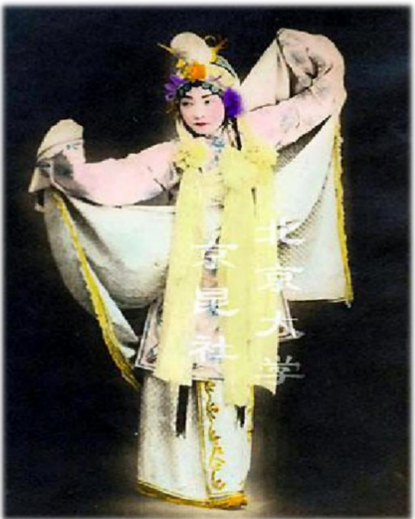
在《白蛇传》中饰演白素贞