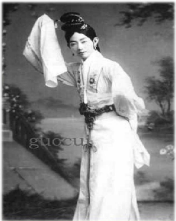
在《嫦娥奔月》中饰演嫦娥